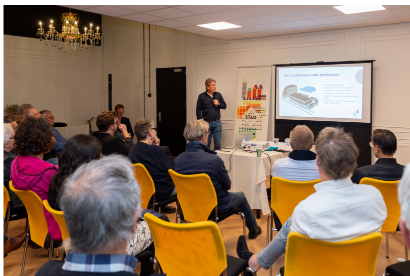
STADgesprek ruimtelijke kwaliteit en bouwtechniek